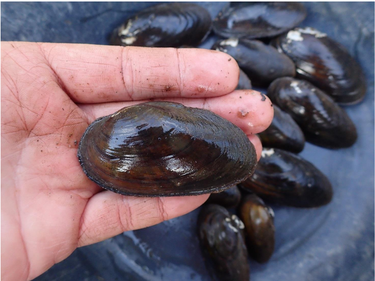
Kuva 2. Vanhankaupunginkosken itähaarassa havaittuja vuollejokisimpukoita 25.10.2017

Joen pohja oli Viikintien yläpuolella vuollejokisimpukalle sopivaa hiekka-, ja sora- ja kivipohjaa. Viikintien sillan ja koskenniskan välisellä jokijaksolla potentiaalisen pohjan määrä väheni, ja siellä havaittiin ainoastaan yksi sysijokisimpukka ja yksi pikkujärvisimpukka. Lisäksi löydettiin kuolleiden vuollejokisimpukoiden kuoria, jotka ovat voineet ajautua ylempää virran mukana. Kosken alaosassa pohja koostui kalliosta ja lohkareista eikä soveltunut vuollejokisimpukalle. Kosken alapuolella joki muuttui suvannoksi, jossa virta heikkeni. Suvannon keskellä ja länsirannalla oli kivien ja lohkareiden ohella myös pehmeää pohjaa, jossa havaittiin soukkojokisimpukan ja pikkujärvisimpukan kuoria.